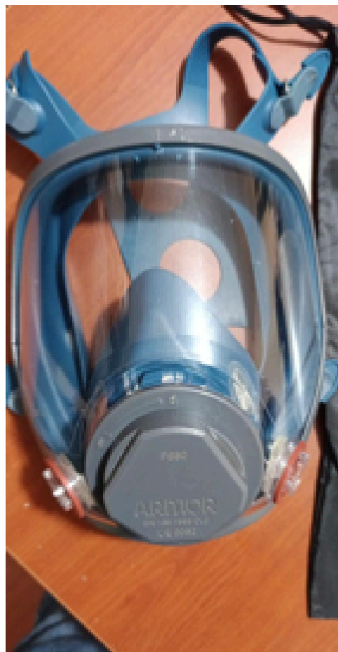
REPARACION DE EQUIPOS PARA ENTREGA A NUEVOS USUARIOS