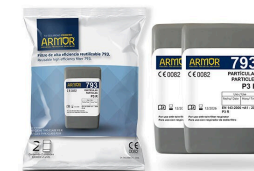
Recuento de FILTROP...