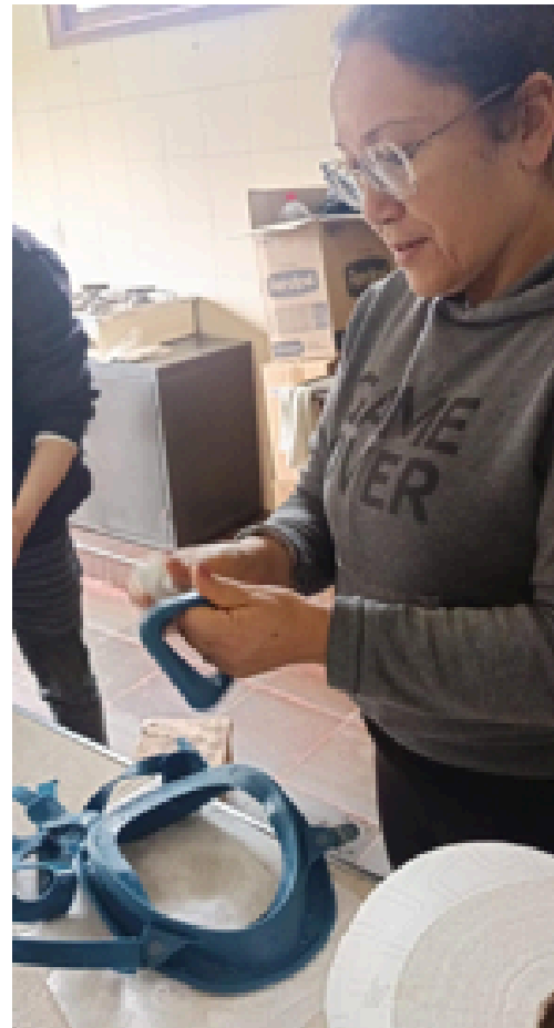
SE REALIZO LAVADO Y DESINFECCION DE CADA UNA DE LAS PIEZAS DESENSAMBLE