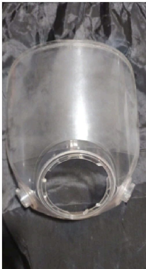
VISOR EN MAL ESTADO SE REALIZO CAMBIO