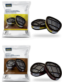
CARTUCHO QUIMICO 4