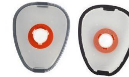
OK ADAPTADOR 520 4