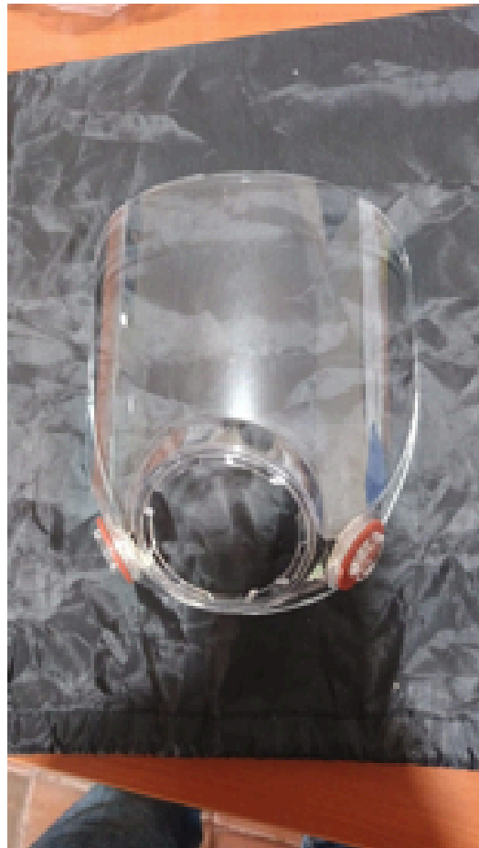
SE CAMBIO POR VISOR NUEVO Y SE INSTALA PROTECTOR